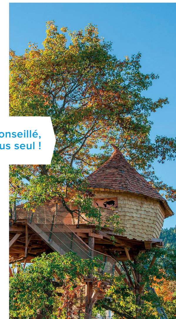
© CV88 - les Cabanes du Chêne Rouvre